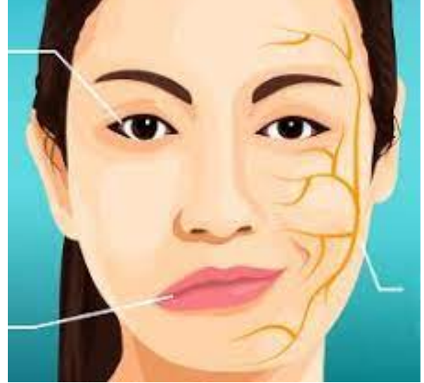
PARALYSIE DE LA MOITIÉ DU VISAGE